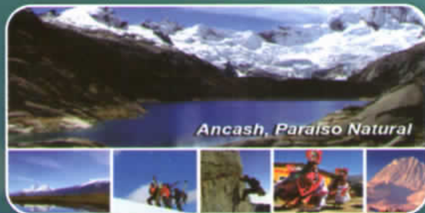
Ancash, Paraíso Natural