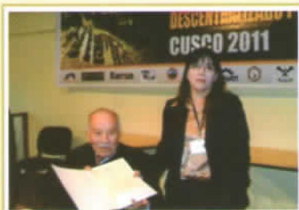
SUNAT, Dra. Karina Castelo Andia

El distinguido plantel de Expositores que participaron en este Congreso en colaboración y apoyo a APEMIPE PERU y los Apemipes del Norte, Centro y Sur del país fueron realmente importantes que, merecieron la atención de los empresarios asistentes y quienes al final de cada exposición fueron reconocidos con fuertes aplausos y asimismo, recibieron un diploma en mérito al reconocimiento de su participación como expositor entre ellos: