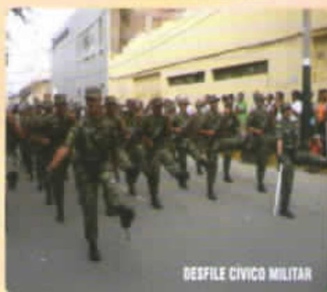
DESFILE CIVICO MILITAR

Luego del izamiento procedió a encender la llama Votiva, culminando de esta manera dicha ceremonia, para luego proseguir con un desfile Cívico Militar donde participaron la Región Militar, Policial, Municipal, Colegios y el Gremio Pyme.