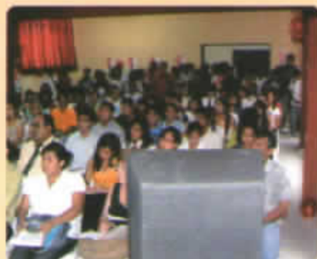
Participantes del Curso de Capacitación