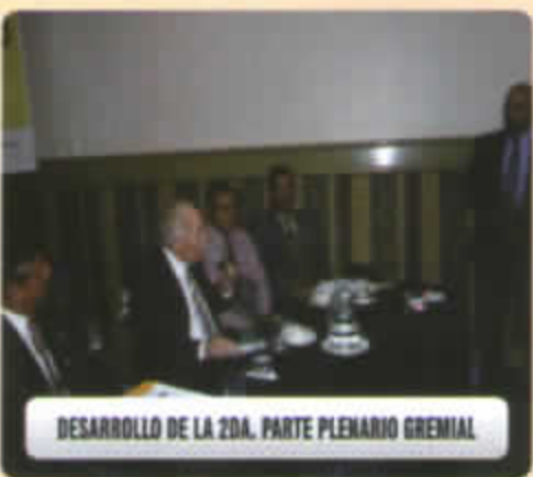
DESARROLLO DE LA 2DA. PARTE PLENARIO GREMIAL

El Presidente Regional Javier Atkins, quien inauguro el 1er. Congreso Empresarial Descentralizado Pyme organizado por Apemipe Peru y las Apemipes del Norte, señalo que el Estado debe trabajar en forma articulada con las Mypes, ya que este tiene una serie de programas dirigidos a las Pequeñas empresas que muchas veces no son utilizados en su beneficio. Es allí donde tenemos que articular programas de capacitación entre el Gobierno Regional y las Mypes, de manera que se beneficien de los programas que otorga el Estado.