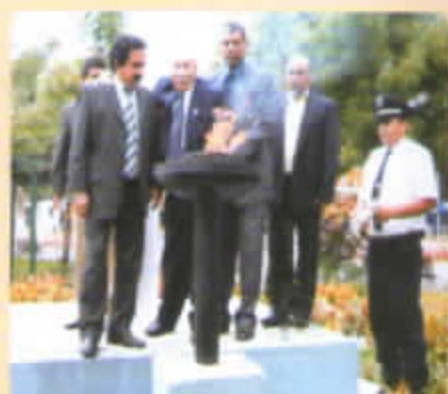
ENCENDIDO DE LA LLAMA VOTIVA

Esta Ceremonia se llevo a cabo el domingo 15 de mayo en la Plaza de Armas de Piura, donde estuvieron presentes autoridades Municipales, Militares, Policiales, así como altas personalidades de Piura especialmente invitados por el Día Nacional de la Pequeña y Micro Empresa.