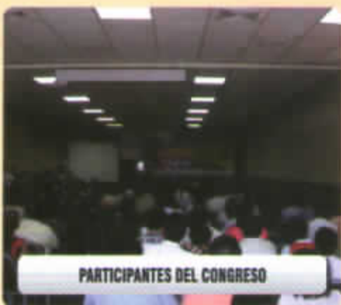
PARTICIPANTES DEL CONGRESO