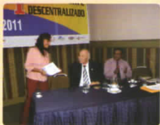
REPRESENTANTE DE LA CAJA MUNICIPAL DE SULLANA