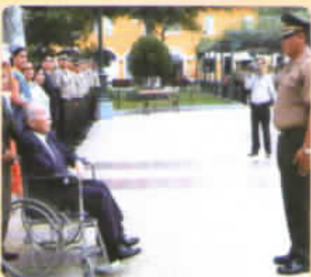
INVITACIÓN A IZAR EL PABELLÓN NACIONAL