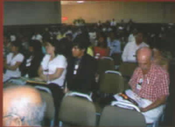
PARTICIPANTES AL CONGRESO LLEVADO A CABO EN EL AUDITORIUM DEL HOTEL COSTA DEL SOL EN PIURA