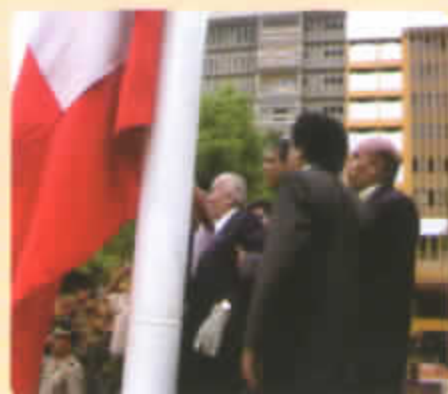
ACTO DEL IZAMIENTO DE LA BANDERA