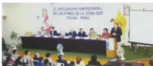
CIUDAD DE TACNA