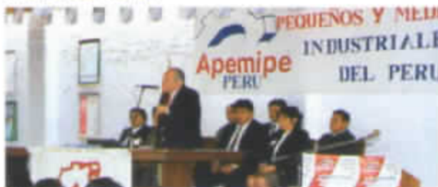
CIUDAD DE PIURA