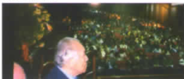
CIUDAD DE CUZCO

El Congreso Nacional convocado por APEMPE PERU y sus filiales en el ámbito nacional, se llevará a cabo el viernes 28 de mayo en la ciudad de Lima de 8:30am. a 6:30pm. en el nuevo Auditorium del edificio de Senati Av. 28 de Julio N° 715 Lima – Cercado.