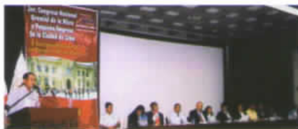
CIUDAD DE LIMA