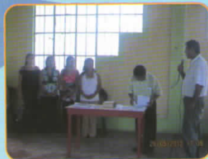
En Reunión con sus Directivos; elaborando su plan de Trabajo 2012-2013