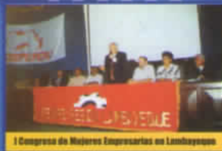
I Congreso de Mujeres Empresarias en Lambayeque