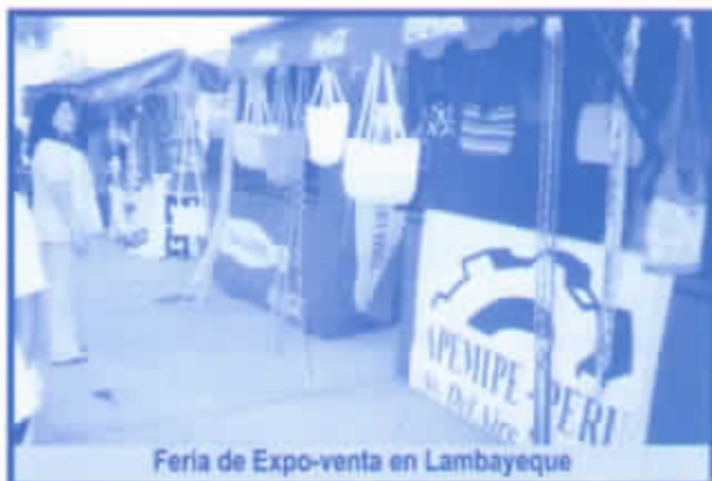
Feria de Expo-venta en Lambayeque