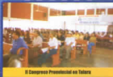
II Congreso Provincial en Talara