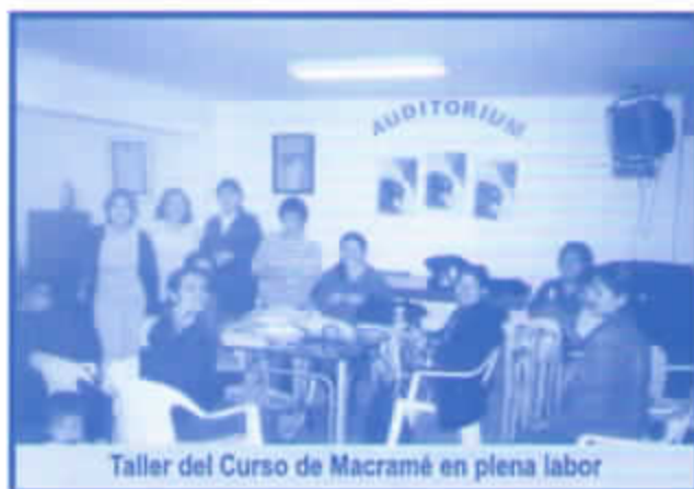
Taller del Curso de Macramé en plena labor