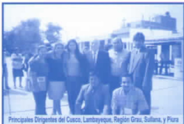
Principales Dirigentes del Cusco, Lambayeque, Región Grau, Sullana, y Piura