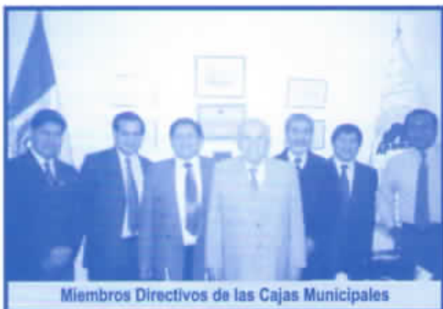
Miembros Directivos de las Cajas Municipales