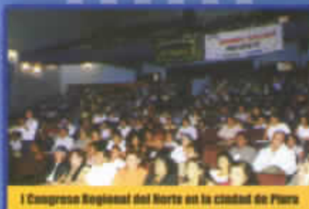
I Congreso Regional del Norte en la ciudad de Piura