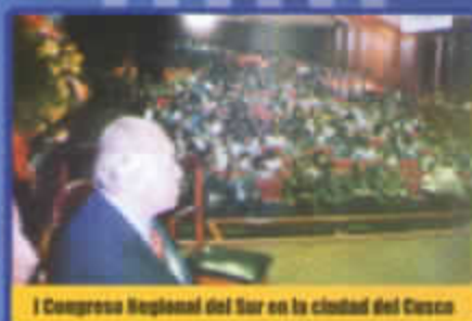
I Congreso Regional del Sur en la ciudad del Cusco