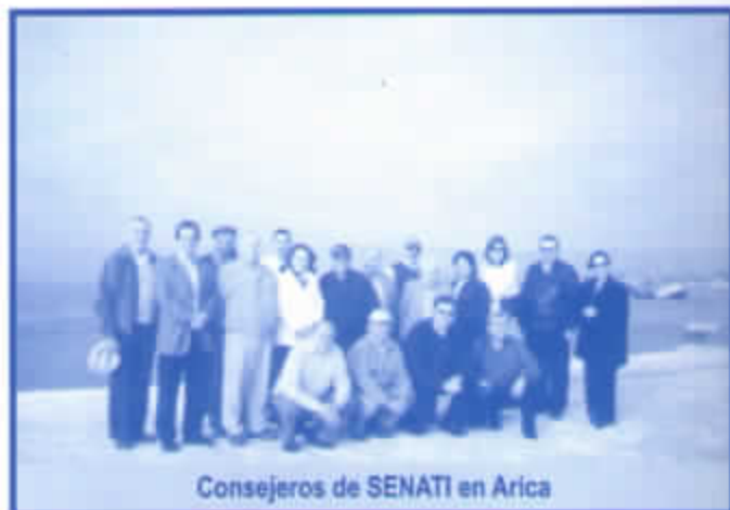
Consejeros de SENATI en Arica

Dicha Sesión se llevó a cabo en la sede de SENATI de la ciudad de Tacna, al término de la cuál, se inicio una visita a los talleres, intercambiando algunos comentarios positivos con los profesores y alumnos, quienes estaban muy reconocidos de la enseñanza y preparación que recibían en este prestigioso centro de estudios técnicos.