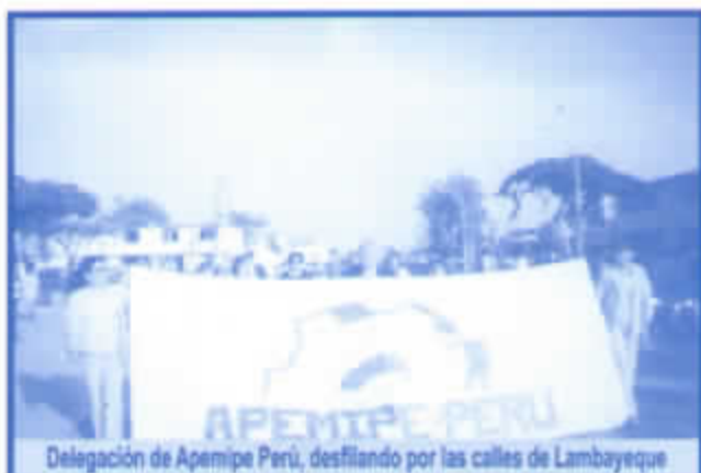
Delegación de Apemipe Perú, desfilando por las calles de Lambayeque