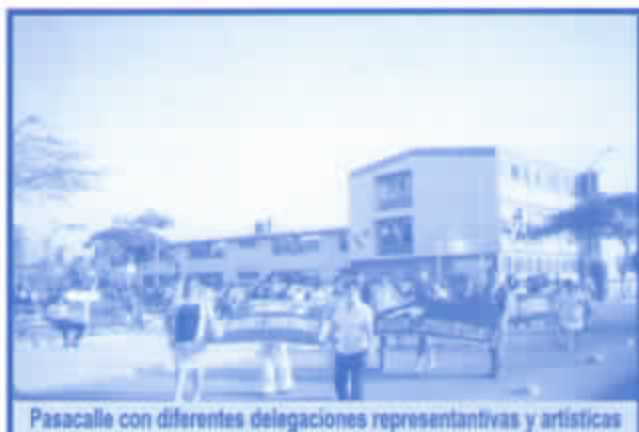
Pasacalle con diferentes delegaciones representativas y artísticas