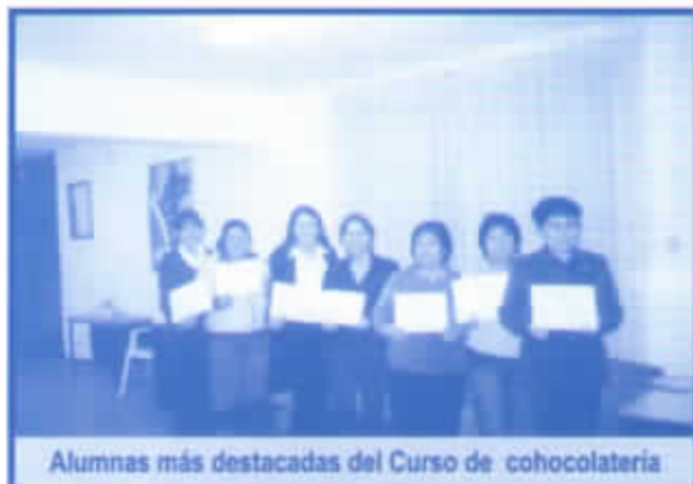
Alumnas más destacadas del Curso de chocolatería