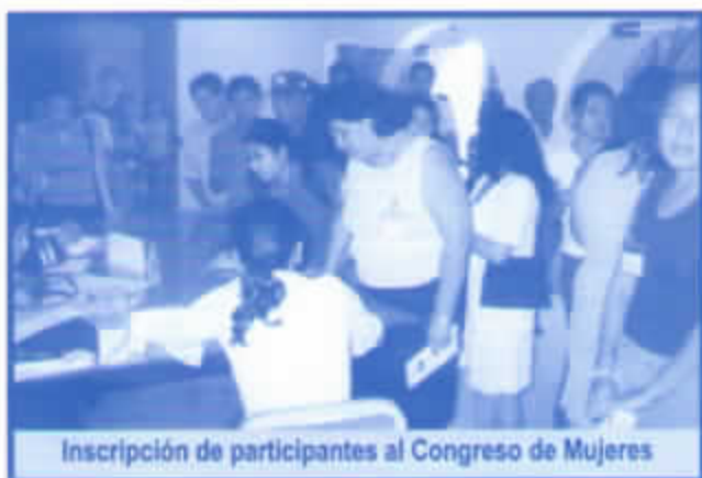
Inscripción de participantes al Congreso de Mujeres