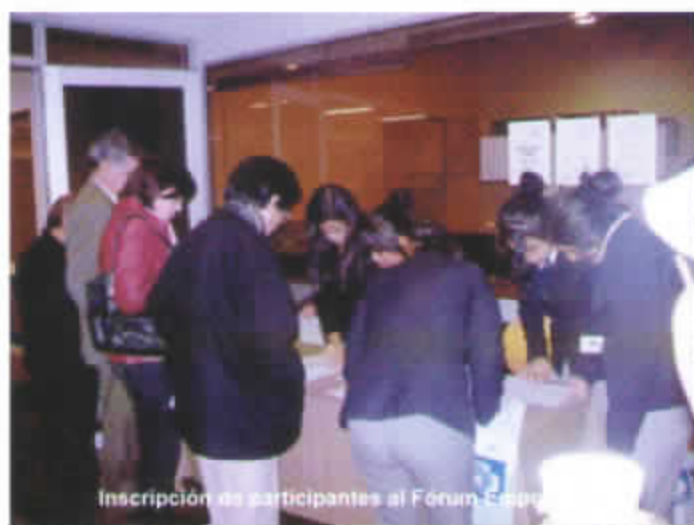
Inscripción de participantes al Fórum Empu