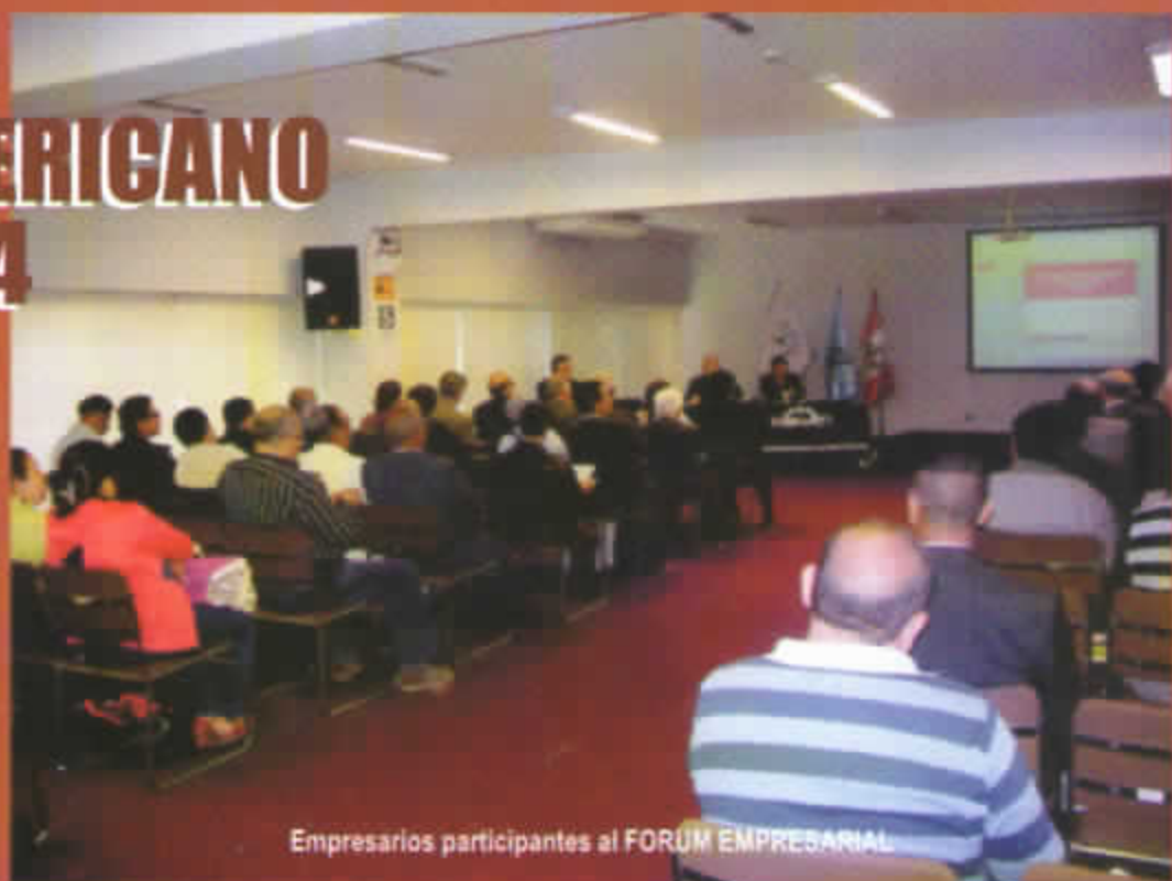
Empresarios participantes al FORUM EMPRESARIAL

Apemipe - Perú, Apemipe Cusco y Apemipe Tambopata - Madre de Dios, convocan a los empresarios de la micro, pequeña y mediana empresa a participar en este importante evento, a llevarse a cabo en el primer semestre del 2014 en la ciudad del Cusco.