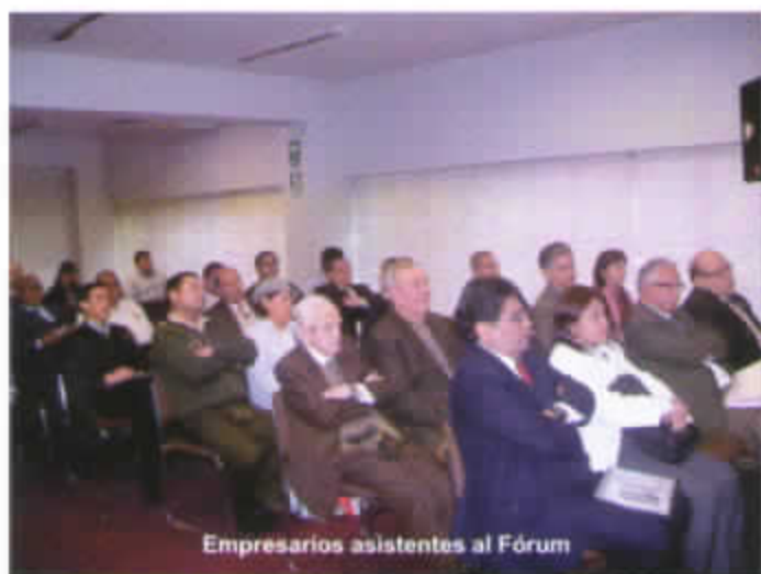
Empresarios asistentes al Fórum