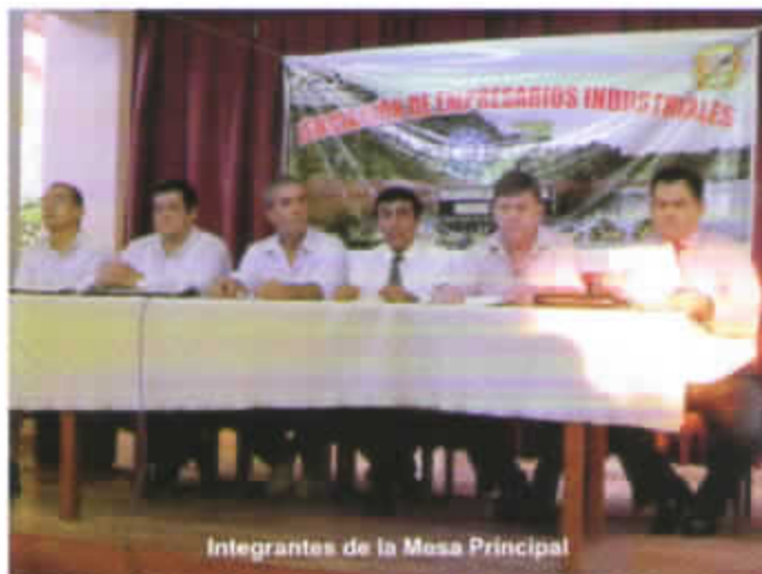
Integrantes de la Mesa Principal

Este encuentro se llevó a cabo desde las 4 pm. hasta las 10 pm. en las instalaciones del local del APAKTONE de Madre de Dios.